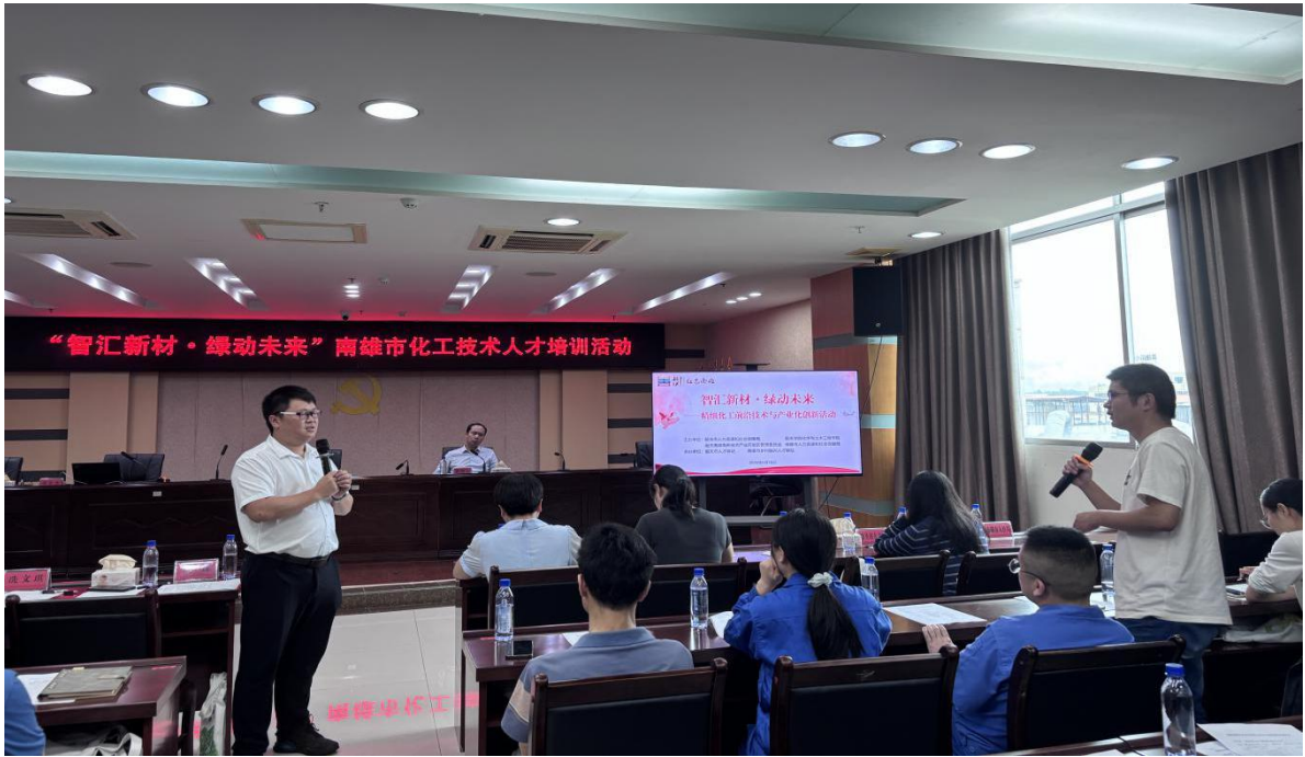
（园区化工人才与专家进行交流）

此次活动有效搭建了精细化工产业“产学研用”深度交流平台，推动破解企业技术研发瓶颈，加速企业成果转化。下一步，韶关市各级人才驿站将持续发挥柔性引才的平台作用，精心打造产才融合枢纽，推动各行业领域创新链、产业链和人才链深度融合，实现产业转型升级和高质量发展。