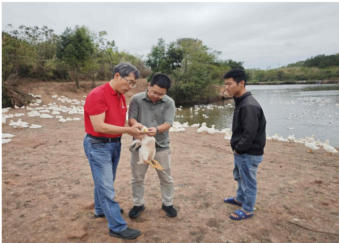
（专家在鸭养殖场进行指导）

少用苗、不用苗”，预防为主、养防结合，充分利用鸭粪养鱼种果蔬等，降低养鱼和种果蔬等农产品的成本，降低饲料、农药、化肥、抗生素的投入，减少农药、抗生素和重金属等有害物质的残留，真正实现生态农业的高质量发展。