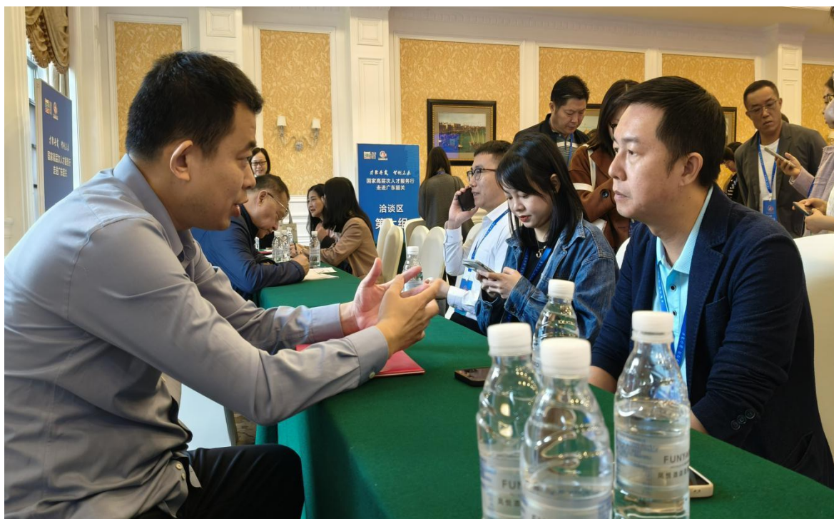
（企业代表与专家深入交流）

拓展了新思路、指引了新方向，获得现场参会代表的一致好评。启动仪式结束后，举办方专门安排了专家与企业代表洽谈交流，洽谈区根据专家研究领域方向分13个小组展开，企业代表积极咨询请教，专家人才正襟危坐、耐心解答，部分企业代表来到多位专家面前请教不同的问题，洽谈现场气氛热烈，供需双方交流深入。参会代表纷纷表示，收获颇丰，一些长期困扰企业发展的问題得到了答案。