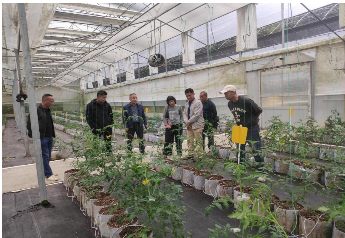
（陆美莲教授到半溪番茄园指导）

为提高坝仔镇半溪村美味番茄品质，打造优质番茄园，推进美味番茄项目发展，11月25日，坝仔镇乡村振兴人才驿站聚焦产业需求，邀请科技特派员陆美莲教授一行到坝仔镇半溪村开展美味番茄种植技术指导活动。