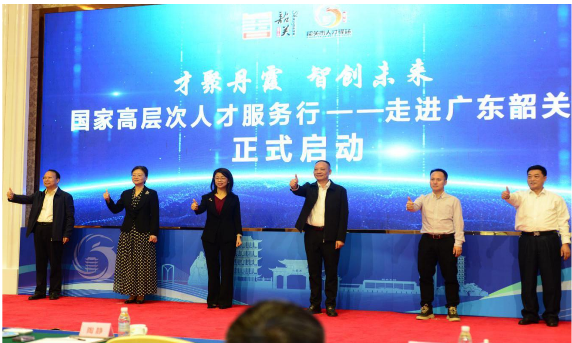
（国家高层次人才服务行活动正式启动）

2024年10月31日-11月2日，国家高层次人才服务行——走进广东韶关活动暨“才聚丹霞 智创未来”人才专题活动在韶关成功举办。活动由广东省人社厅发起，人社部留学人员和专家服务中心指导，广东省人才服务局、韶关市人社局共同主办，韶关市人才服务局、韶关市人才驿站具体承办。国家级专家人才代表团、韶关市各行业部门、企事业代表参加了活动。