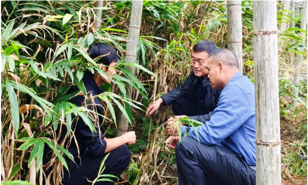
（专家团队深入一线指导）

11月22日，仁化县乡村振兴人才驿站与南方医科大学公共卫生学院到石塘镇开展“双百行动”调研指导，研究推进解决阳春砂授粉难题，助力仁化县中药材种植。