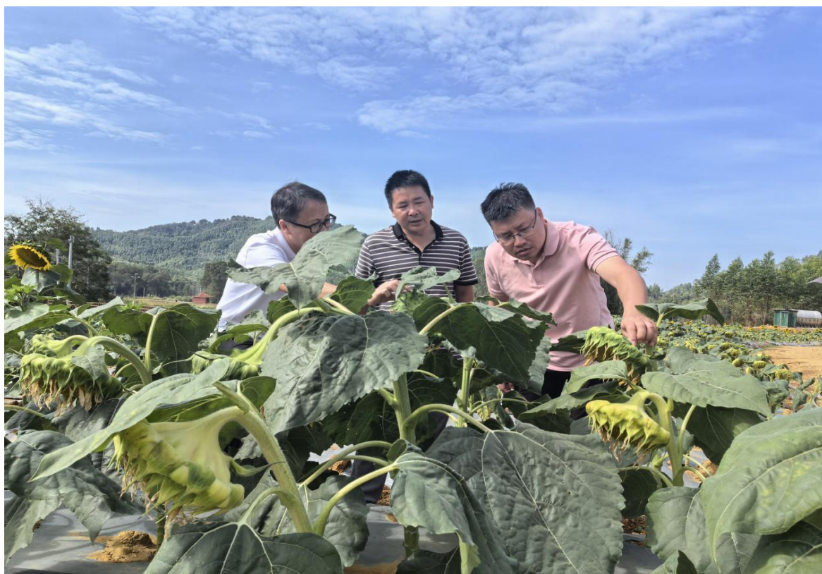
（专家深入基地一线指导）

“博士的话我们都记下来了，根据建议，接下来会试种更适合观赏的向日葵品种，同时，撒播种植其他花卉，降低种植成本，提升经济效益。”