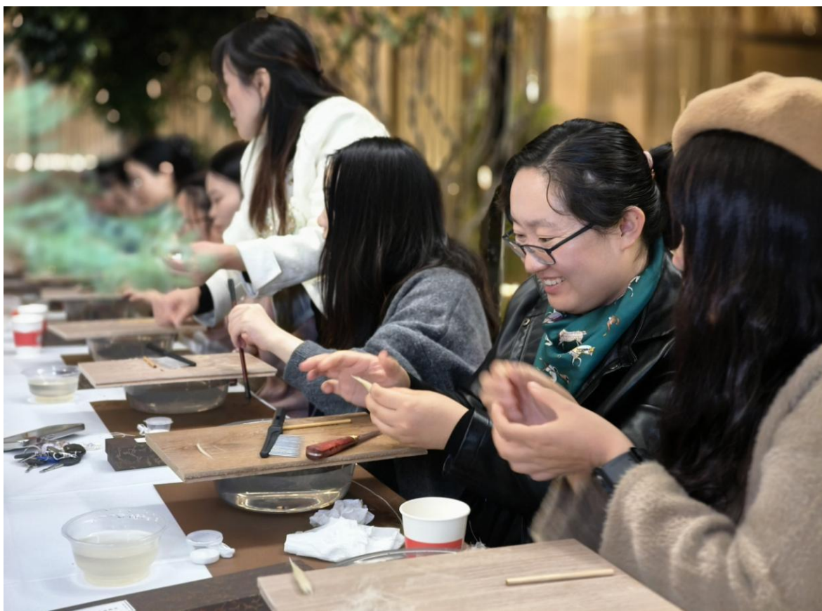
（人才分享制作毛笔技巧）

杂，一支好的毛笔需要经过 72 道工序，14 道大工序，高品质毛笔的制造，全凭手工技艺，迄今仍是机器不可替代的产物。随后，老师亲自指导毛笔制作流程，从选料开始，详述羊豪、狼毫、兼豪等不同毛料特质与适配书写风格。人才们在老师的指导下，全神贯注地从选毛、梳毛开始，再到清锋、镶嵌，每一步操作都努力让每一束毛都达到“尖、齐、圆、健”的要求。最后，人才们纷纷展示自己制作的毛笔成品，并分享制作中的技巧。