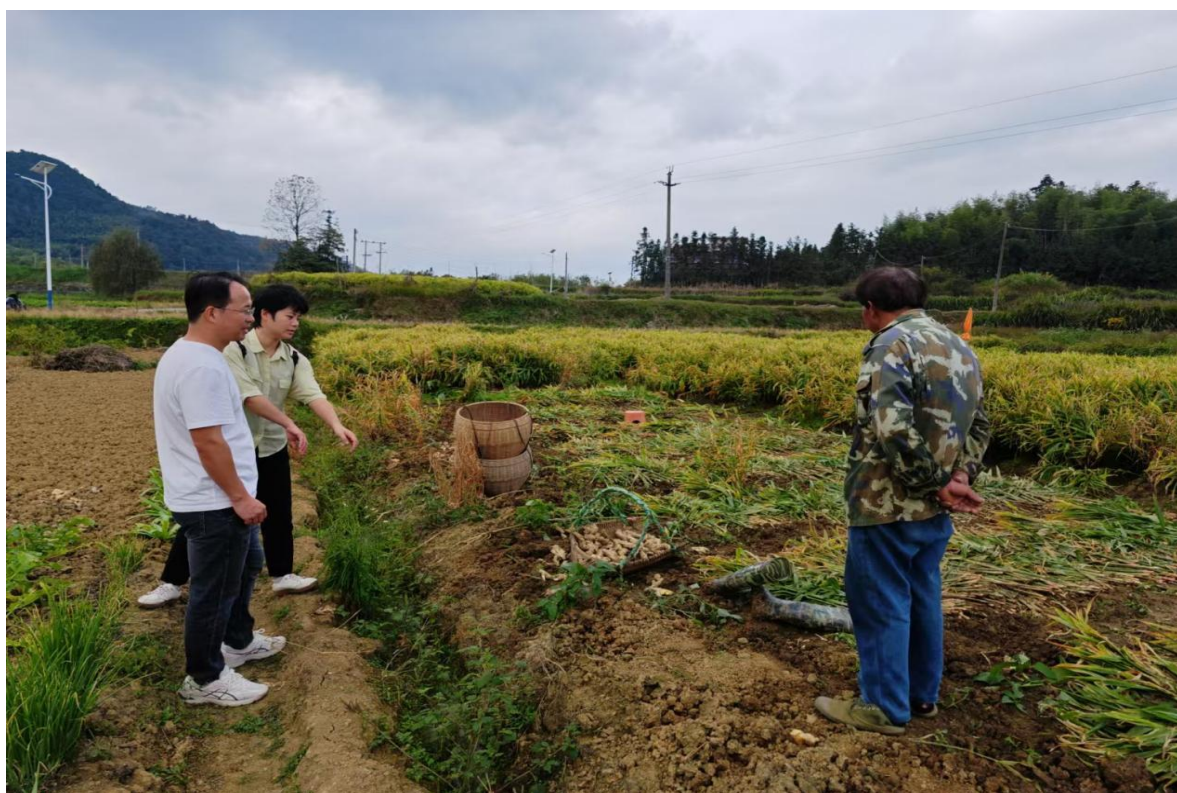
（专家前往农户种植地指导）

香芋、马蹄、生姜等优质种苗，并表示了对于新品种和组培新技术的兴趣。对此，专家们表示南繁种业研究所响应国家“南繁硅谷”、“种业振兴”和“乡村振兴”等重大战略，致力于种质资源的创新、育种技术的提升、栽培营养的优化以及资源的循环利用等关键研究领域。他们确信，双方在科研合作、技术服务以及成果转化方面具备显著的合作潜力。席间，双方均表示将加强沟通，深化合作，共同推进乐昌农业产业的发展。此次调研活动还访问了坪石镇的驻镇帮扶工作队，双方就坪石的农业种植现状和产业发展问题进行了深入探讨，为当地农业发展提供了有力的支持和建议。