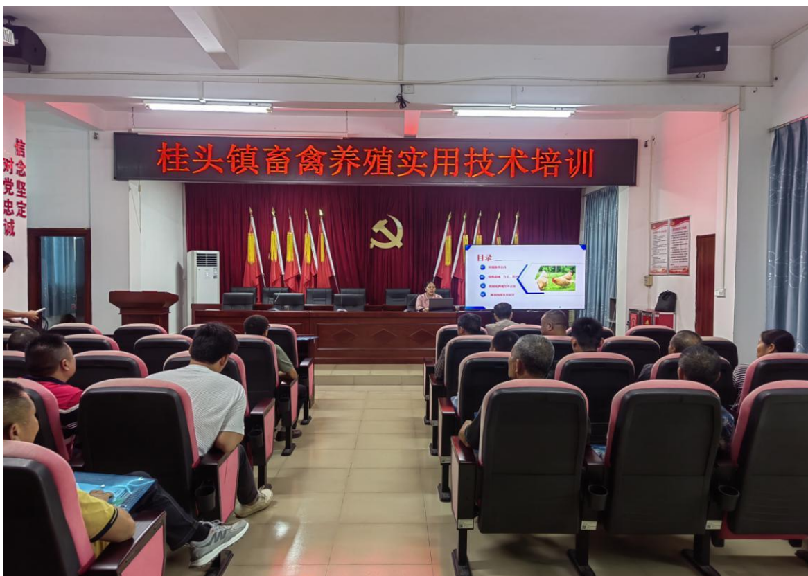
(养殖技术培训现场图)

和紧迫性，并详细介绍了乡村振兴促进法的主要内容。古老师深入剖析了乡村振兴的战略意义、主要任务和保障措施，使大家对国家乡村振兴战略有了更加全面、深入的了解，在讲解“五大振兴”的过程中，强调了人才驿站在乡村振兴中的重要作用，通过引进更多人才、技术、项目等优质资源，为农民提供全方位、多层次的服务，作为养殖大户，要深入了解相关政策，积极争取政府的支持和帮助，共同推动乡村振兴事业的发展。