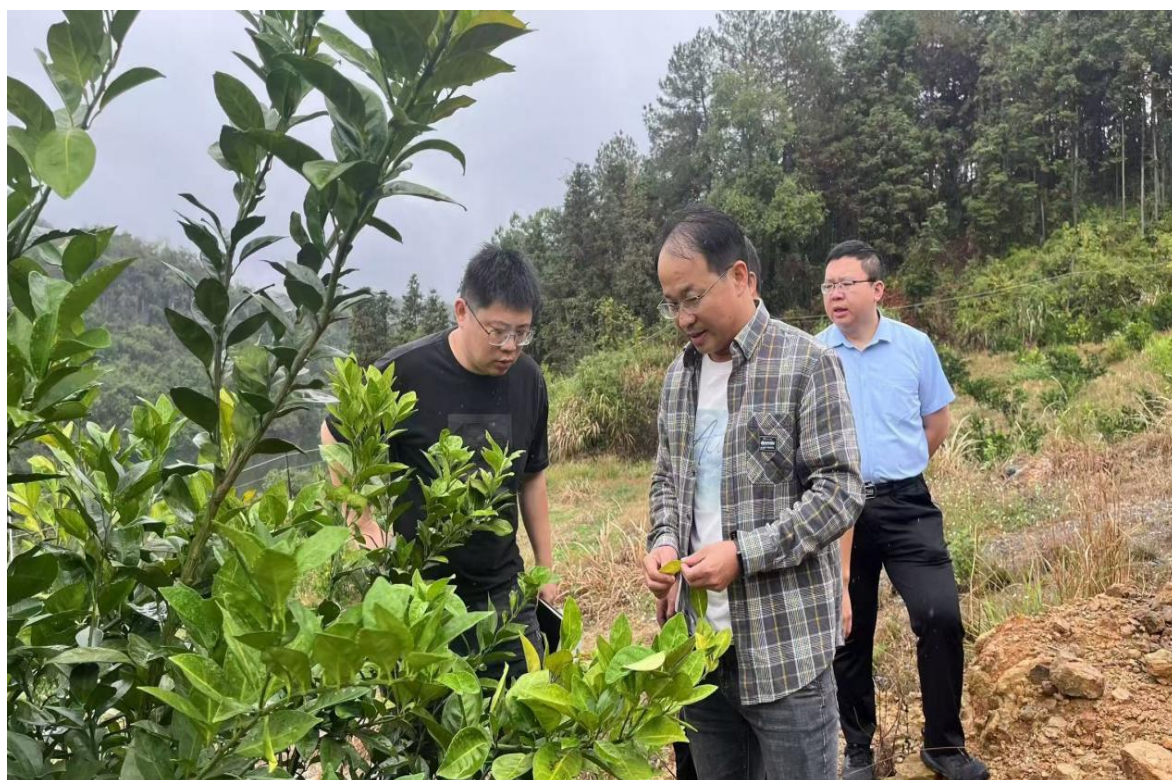
(专家团队深入一线基地)

为落实实施“百县千镇万村高质量发展工程”的决策部署，推动科技成果转化并加强与地方企业的合作，11月13日-15日，乐昌市乡村振兴人才驿站牵头对接广东省科学院南繁种业研究所(南繁种业研究所)专家团队前往乐昌市开展了调研交流活动。