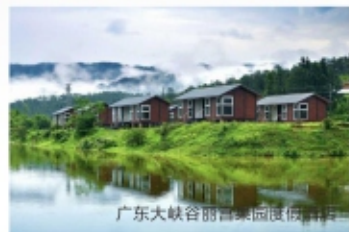
广东大峡谷丽宫果园度假酒店