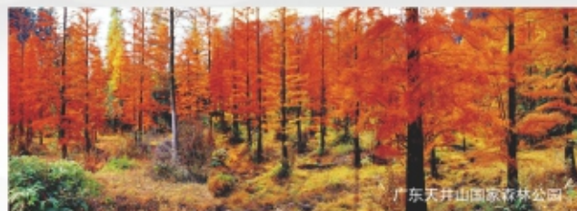
广东天井山国家森林公园