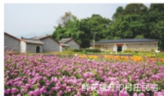
鲜花盛开的村庄民宿