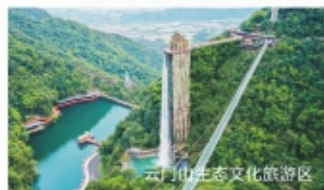
云门山生态文化旅游区