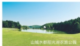
山城水都阳光湖农旅公园

住宿推荐： 丽宫国际旅游度假区、鲜花盛开的村庄民宿、蝴蝶谷民宿、遇见·过山瑶酒店、云门山生态文化旅游区