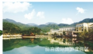
丽宫国际旅游度假区