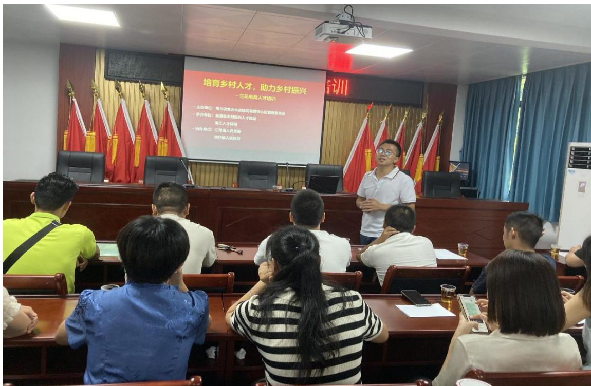
（兰花电商人才培训活动中）

为提升兰花电商企业销售水平，强化兰花电商人才队伍建设，助力翁源县乡村产业振兴工作，推动翁源县兰花产业高质量发展，6月29日，粤台管委会联合翁源县乡村振兴人才驿站和滙江人才驿站在江尾镇松塘村会议室举办“培育乡村人才、助力乡村振兴”兰花电商人才培训活动，邀请专家讲师结合兰花文化、种植及养护等讲解兰花电商销售技能。翁源县兰花电商企业（个体户）参加培训。