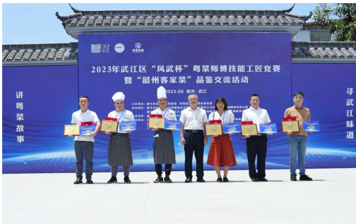
（粤菜师傅技能工匠竞赛评出一二三等奖）

通过组织本次活动，为凤岗武江两地粤菜师傅从业人员搭建了展示厨艺技能风采的舞台，通过以赛促学的方式，提高了“粤菜师傅”技能水平，同时充分挖掘乡村多元价值，擦亮“韶州客家菜”独特地方品牌，评选出了一批“武江粤菜师傅”、“武江十大厨娘”、“武江十大名菜”，让技能人才也有展示自己才华的机会，同时，通过竞赛能够让技能人才的水平得以提高，达到以赛促学的目的。