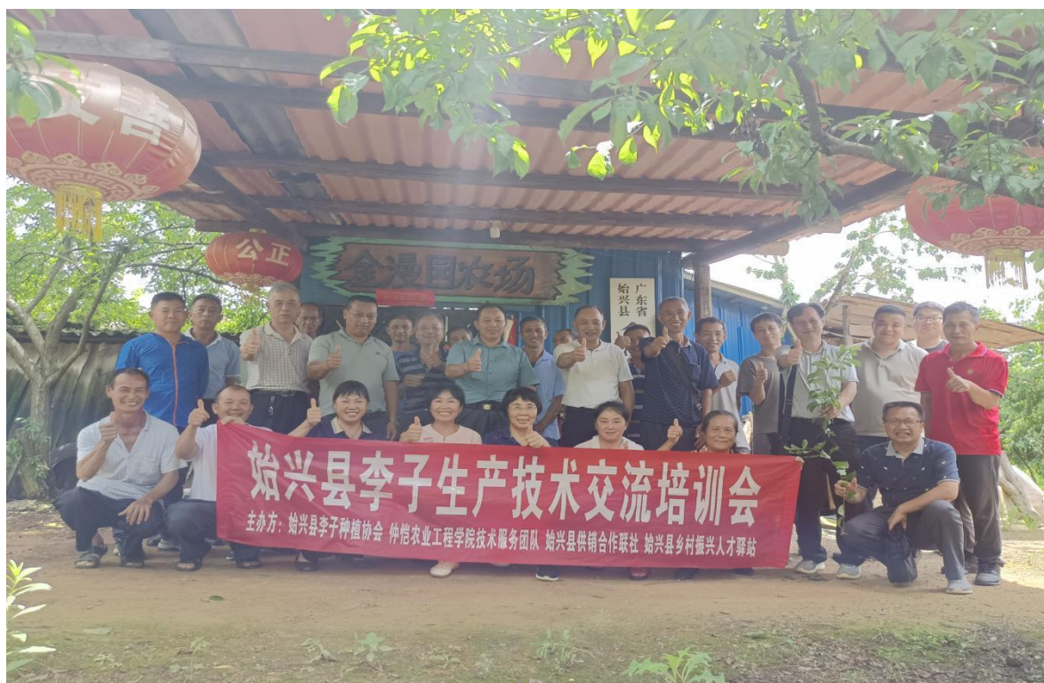
（始兴县李子生产技术交流培训会合影）

6月26日，为进一步提升始兴县李子等水果生产技术，始兴县乡村振兴人才驿站联合始兴县供销合作联社、始兴县李子种植协会，邀请仲恺农业工程学院的教授团队到顿岗镇宝溪村开展李子生产技术交流培训，来自全县各乡镇近30户李果专业种植户参加了此次培训会。