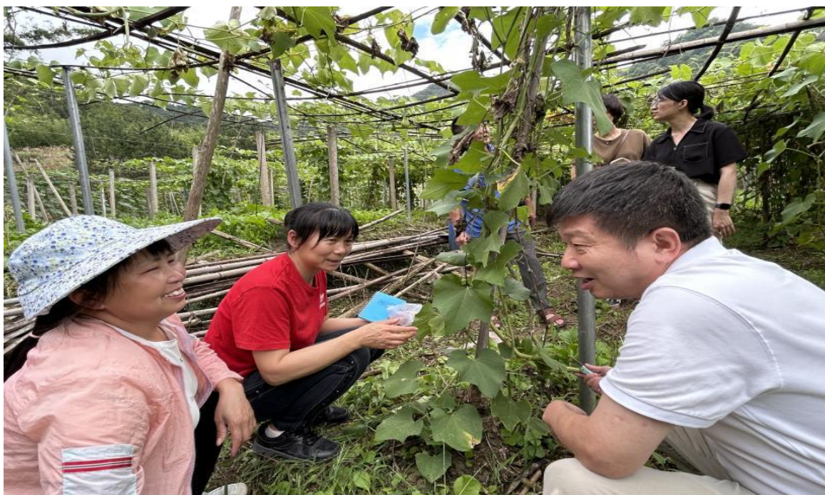
（图为专家查看佛手瓜种植情况并与农户交流）

此次专家现场“把脉开方”，为农户送来实用的种植技术，切实提高农户的种植、管理水平。接下来，黄磬镇将紧紧围绕“百县千镇万村高质量发展工程”目标任务，不断强化农业产业发展质量，充分发挥镇乡村振兴人才驿站作用，多形式开展农业种植技术培训、技术指导等活动，进一步提高农户种植、管理水平，及时解决佛手瓜、美少女西瓜等种植过程中存在的问题，做大做强“两瓜、两茶、两花”特色产业，助推黄磬高质量发展。