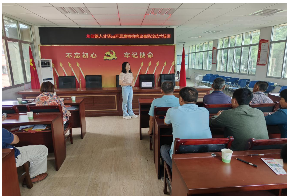
（龙仙镇人才驿站开展鹰嘴桃病虫害防治技术培训现场）

为助力乡村振兴充分发挥乡村振兴人才驿站的引才育才作用，进一步落实好龙仙镇高素质农民培育工作，加快龙仙镇有文化、懂技术的高素质农民队伍建设，6月16日，龙仙镇联合翁源县乡村振兴人才驿站，在龙仙镇人才驿站培训基地举办鹰嘴桃病虫害防治技术培训班，邀请广东省农科院果树研究所副研究员常晓晓老师过来授课，龙仙镇李洞村和石背村部分村民、“一村一品”项目实施主体、鹰嘴桃种植户共48人参加培训。