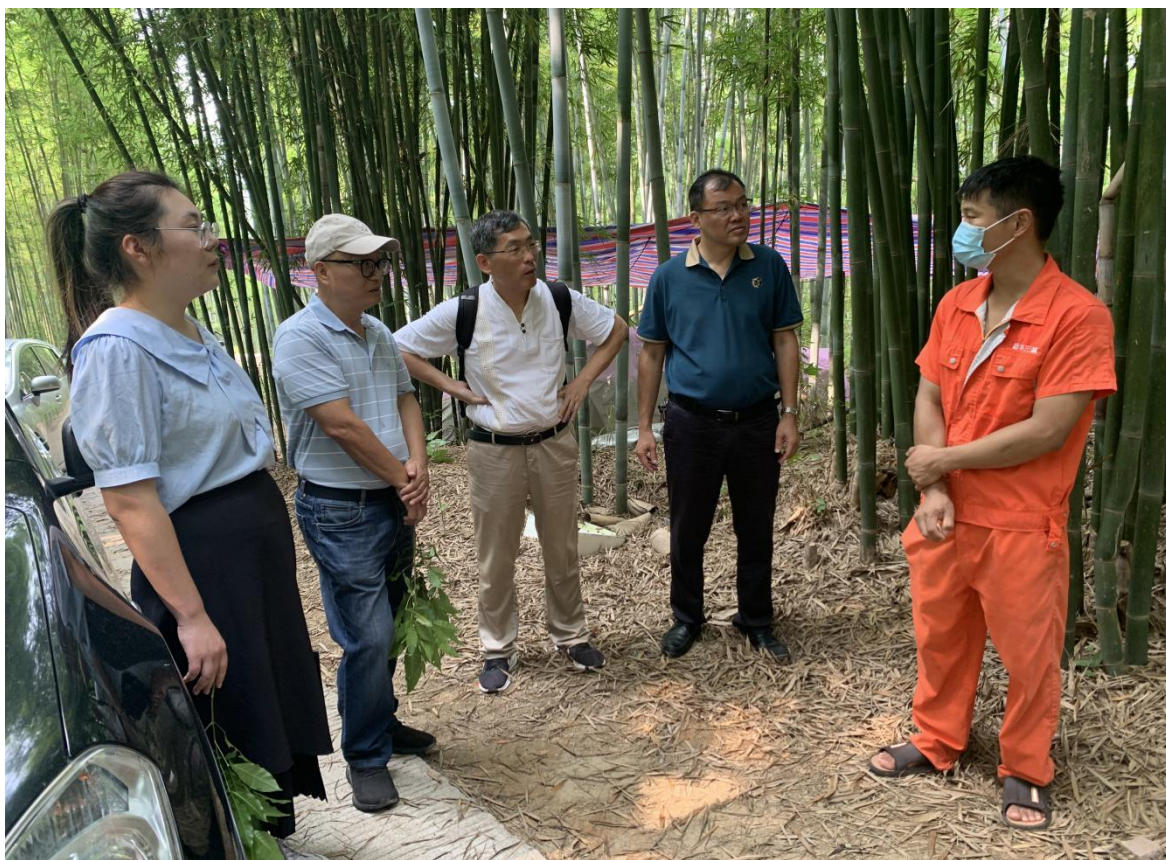
（图为专家团队实地走访生猪养殖企业并与员工交流）

据悉，本次活动是县、镇两级乡村振兴人才驿站推动人才入县下乡的具体举措，也是新丰县与韶关学院人才共培共享合作的重要实践。接下来，全县各级乡村振兴人才驿站将充分利用专家库资源，发挥好桥梁作用，继续为乡村全面振兴引才聚智，助推县域经济社会高质量发展。