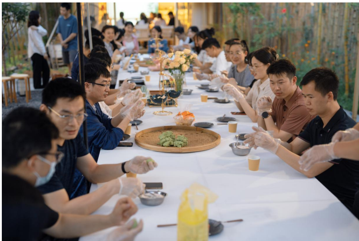
（在韶人才认真准备配料）

为丰富在韶人才业余生活，加强人才之间的互动交流，为爱好粤北传统文化的在韶人才搭建学习和交流的平台，6月2日，韶关市人才驿站在武江区腾文筱院开展“人才兴趣课堂”系列——客家手工糍粑制作体验活动，36位在韶高层次人才参与了此次活动。