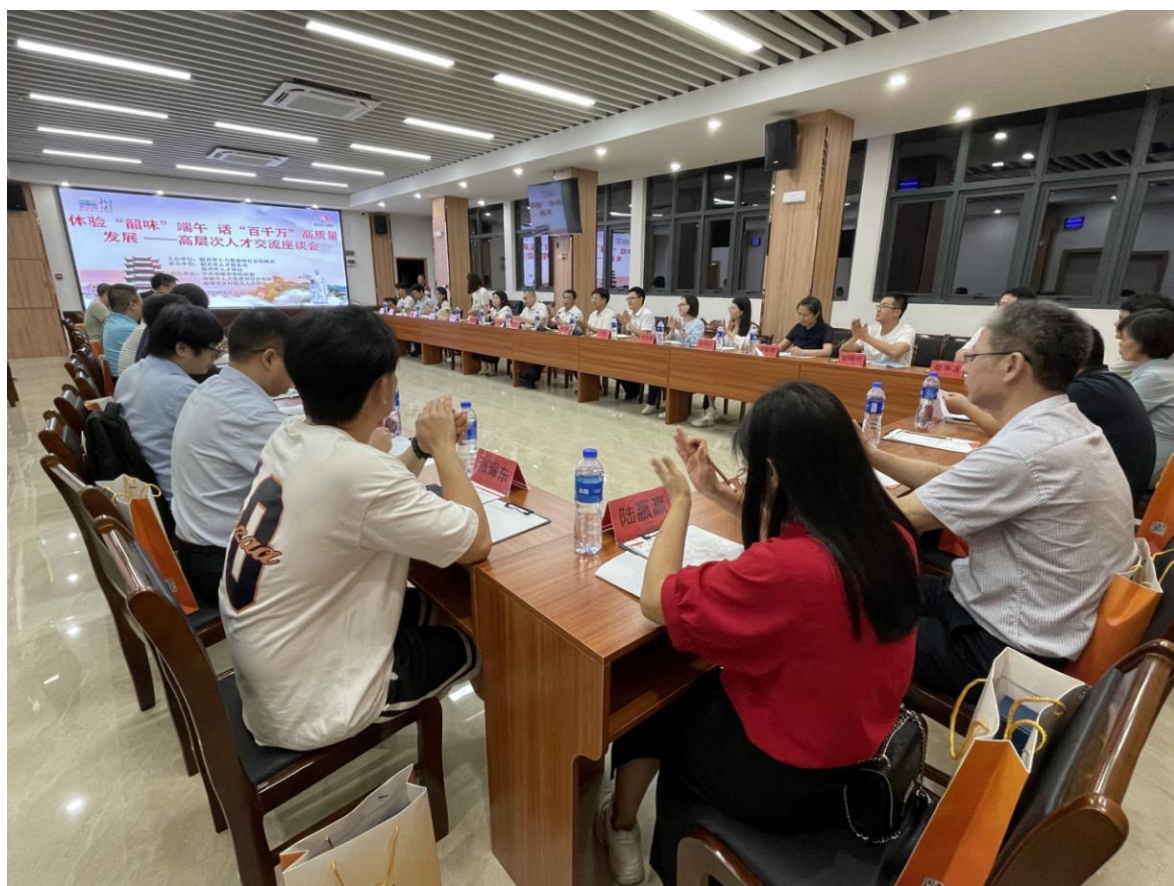
（高层次人才交流座谈会现场）

才的需求就是我们服务的目标，下一步我们将依托人才驿站继续开展好各类人才活动，为韶关的人才提供资源互通、交流合作的平台”。