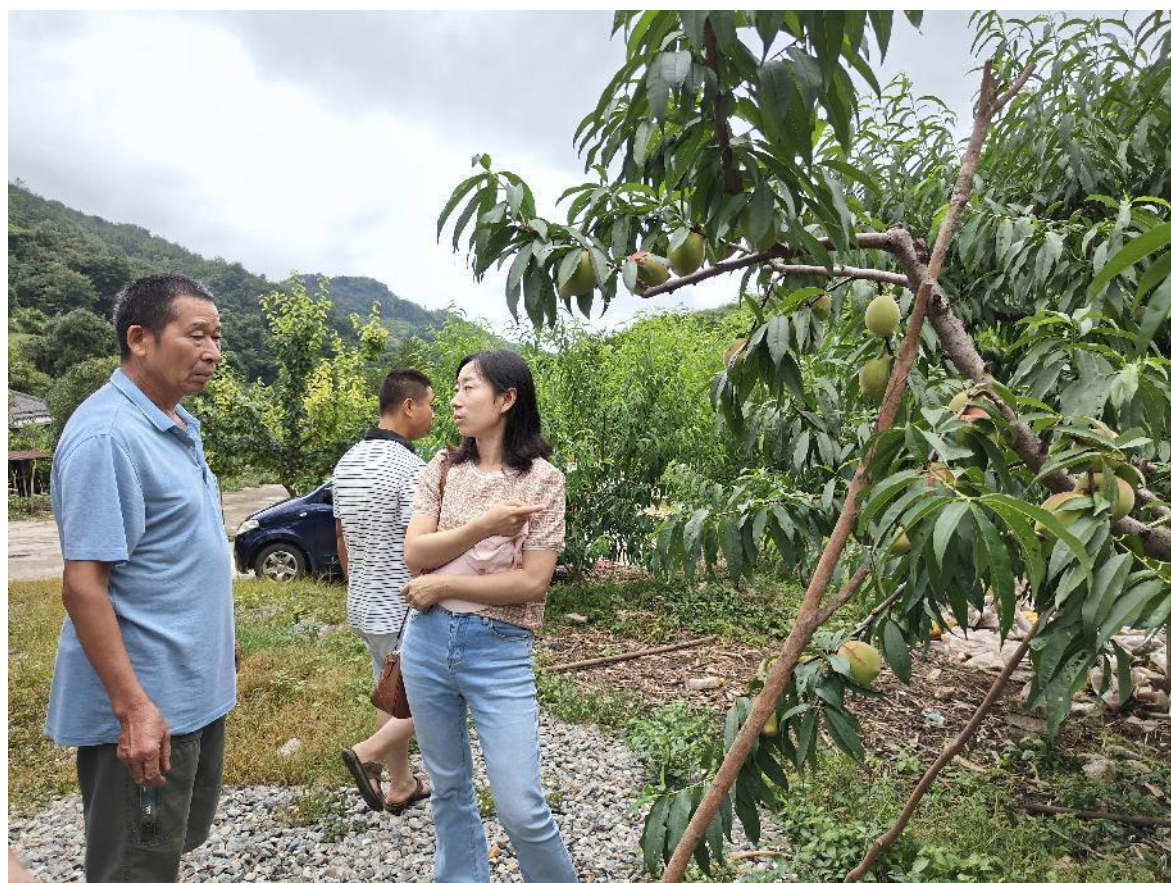
（省农科院常老师到鹰嘴桃种植基地进行实地指导种植技术）

随后，常老师到鹰嘴桃种植基地进行实地指导种植技术，学员们认真听取了专家的示范指导。学员们纷纷表示，通过此次培训班，开阔了思路、提升了种植技能，增强了种植鹰嘴桃信心。