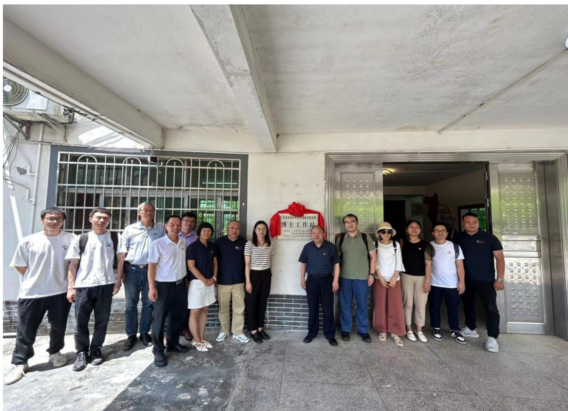
（图为举行村级博士工作站揭牌仪式）

博士工作站合作共建等举措，有助于进一步强化党建引领，推动农业科技人才进村入企，促进农业科技成果转化应用，探索形成院地企业合作共建共享共赢新模式，更好地助力乡村振兴，推动宜居宜业和美乡村建设。共建协议签约后，省农科院环境园艺研究所将定期派出党员干部和博士专家到高桥村，为村里带来先进的工作理念、种植技术、优质农作物品种等，帮助高桥村打造成为农文旅融合发展的精品特色村。