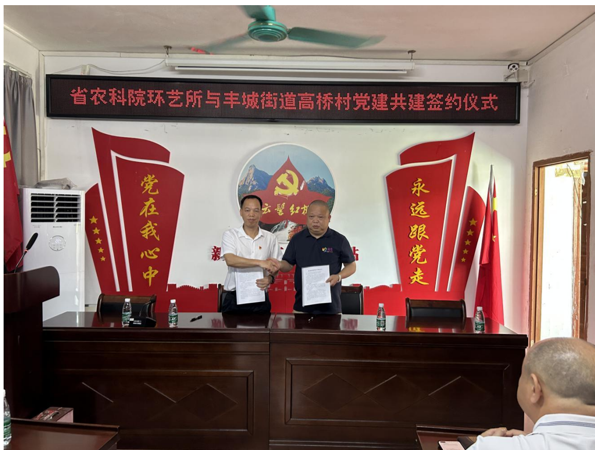
（图为举行党建共建签约仪式）

为进一步推动实施“百县千镇万村高质量发展”工程，以高质量党建引领高质量发展，推动人才资源向乡村产业发展集聚，6月8日，省农科院环境园艺研究所所长、享受国务院政府特殊津贴专家朱根发率领其他硕博专家一行10人到新丰县丰城街道高桥村举行党建共建签约仪式，并为新丰县首个村级“博士工作站”揭牌。