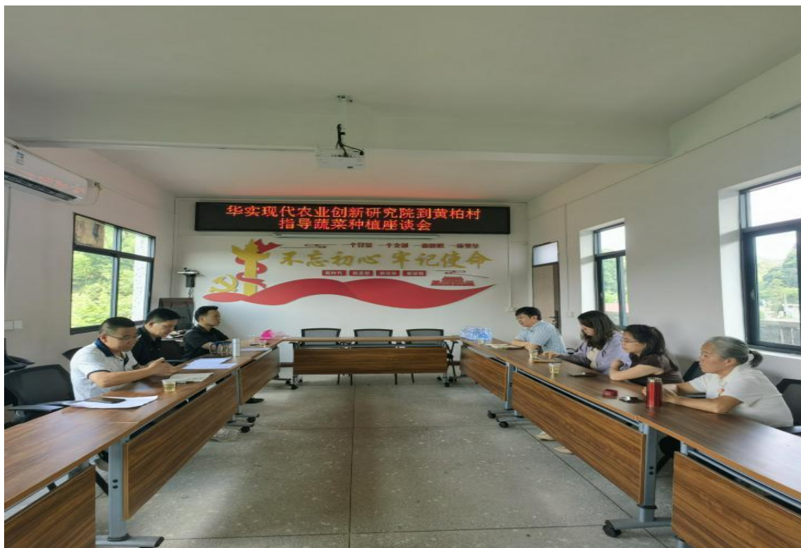
（专家组与黄柏村委就蔬菜种植问题深入交流）

接下来，梅坑镇将紧紧围绕“百县千镇万村高质量发展工程”目标任务，依托蔬菜种植历史悠久的资源禀赋，充分发挥镇乡村振兴人才驿站招才引智作用，通过加强技术指导和开展多种形式的蔬菜种植培训，持续提高农户和蔬菜公司在蔬菜种植、运输、销售等环节的管理水平，不断提高镇村蔬菜产业规模和提升影响力，确保蔬菜产得下、销得出、收入稳，助推梅坑镇域经济社会发展和乡村振兴。