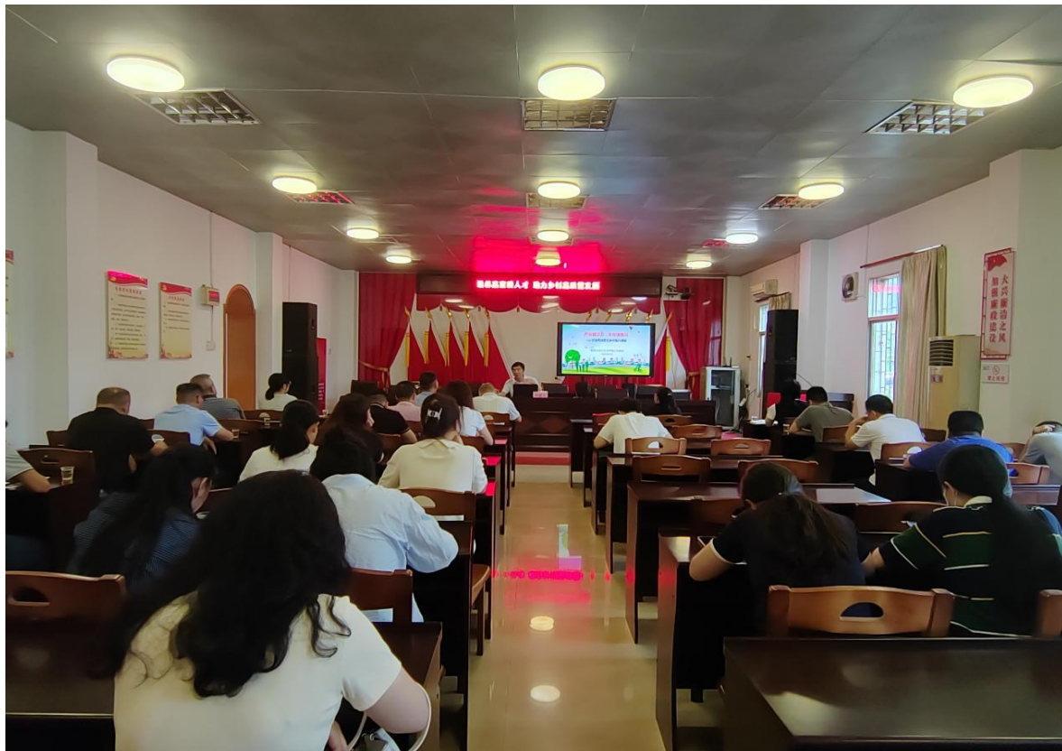
（花坪镇开展乡村振兴人才驿站技能培训活动）