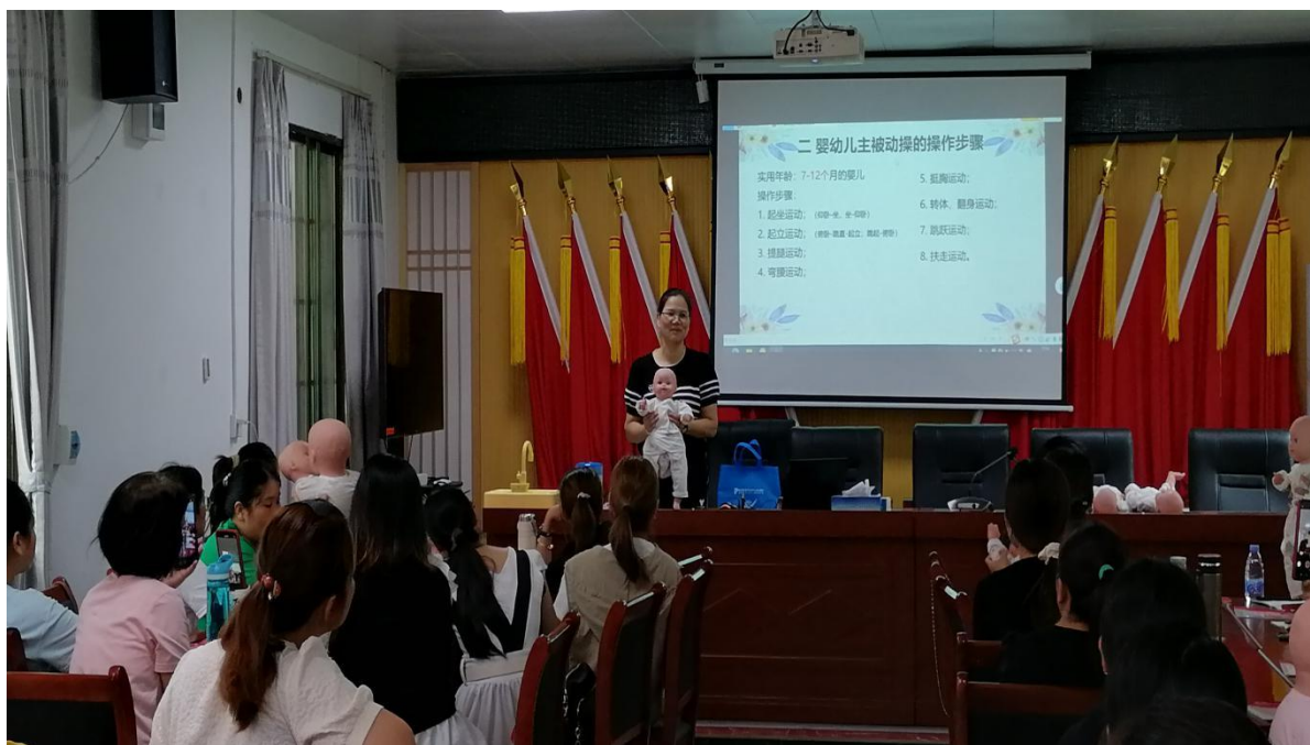
（滙江职业培训学校老师讲授操作步骤）

为了帮助基层妇女提高致富能力，培养造就素质优、技能强的家政从业人员、育婴员队伍，推动妇女就业、创业、创新发展，镇人才驿站邀请滙江职业培训学校于6月17日-18日承办育婴员（中级）技能公益培训。本次活动培训吸引了辖区35名妇女参加。