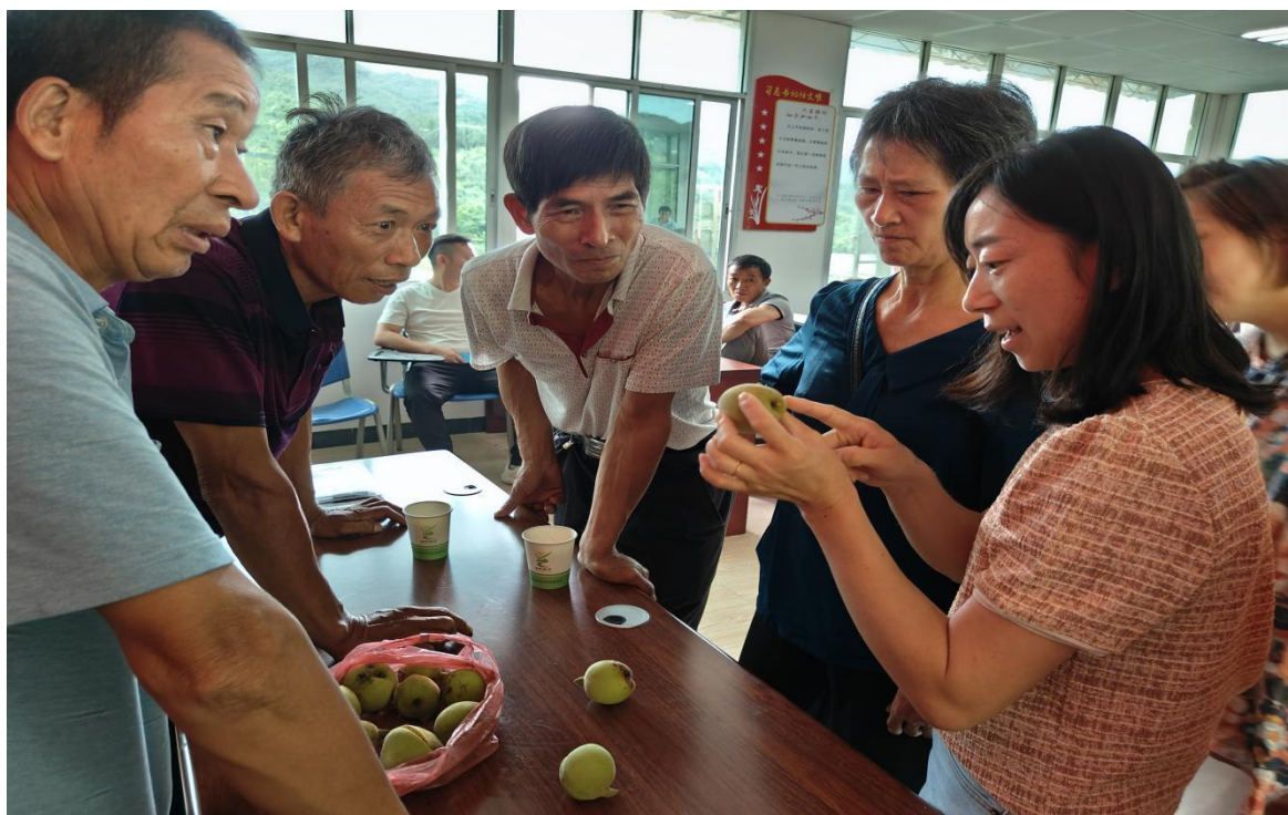
（省农科院常老师对学员提出的疑问进行现场答疑）

活动中，培训学员各自提出自身在种植鹰嘴桃过程中遇到的难点痛点问题，常老师对此一一答疑解惑，为龙仙镇鹰嘴桃产业发展献计献策，提出建设性意见建议。