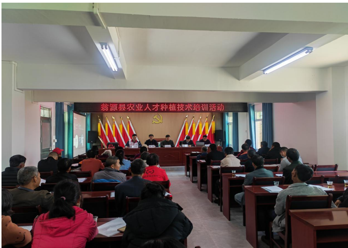
（种植技术培训活动现场）

乡村振兴，产业先行。为提高农村种植户的种植技术水平和农业种植效益，2月23日，翁源县乡村振兴人才驿站联合周陂镇党委、政府、驻镇帮镇扶村工作队到周陂镇崑山村开展农业种植技术培训活动，此次活动邀请了华南农业大学教授张新明进行授课，崑山村的50余名农户参加了此次培训。