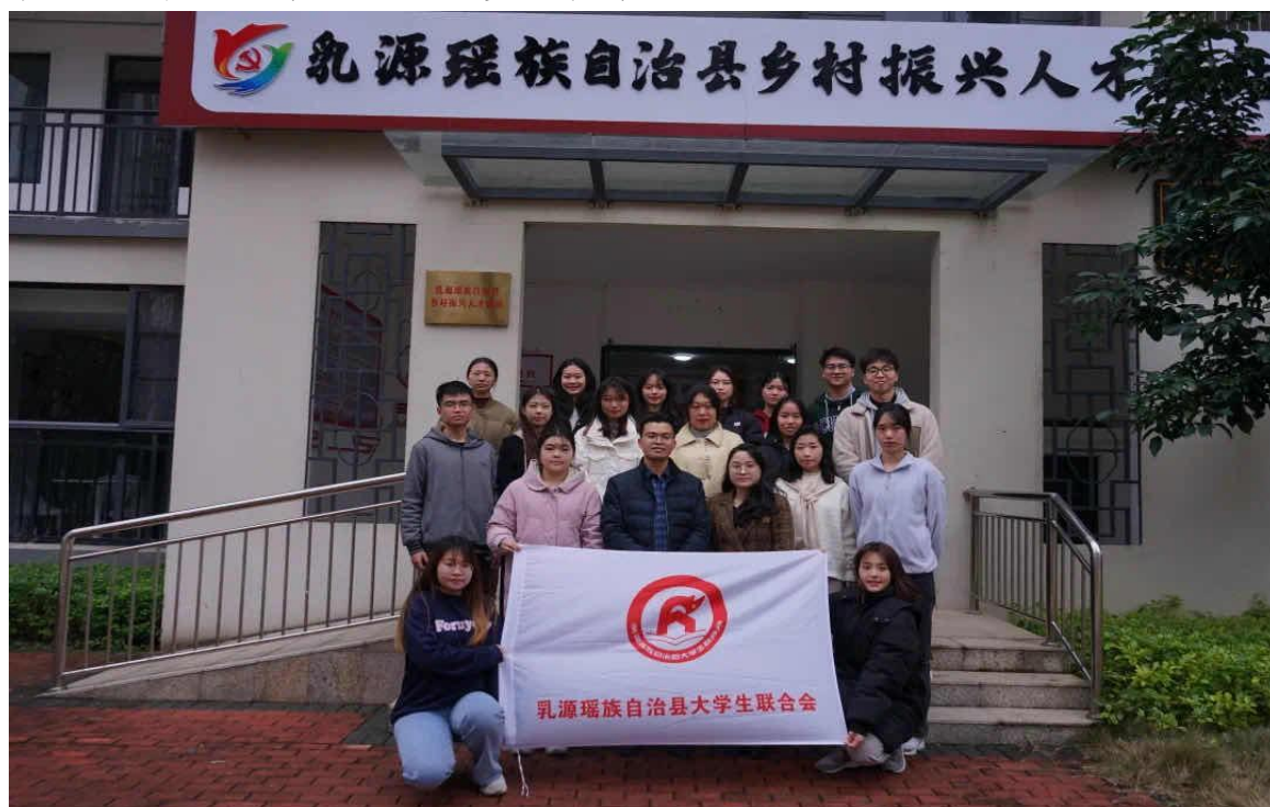
(返乡大学生在驿站合影图)

本次座谈会，为联系和服务乳源籍大学生搭建了良好的交流平台，增加了感情，交流了思想，引导在外学子更加深入的认识家乡、了解家乡、热爱家乡，推动乳源籍大学生与家乡的发展同频共振。下一步，县乡村振兴人才驿站将联合团县委持续开展返乡大学生社会实践系列人才引进培育活动，吸引更多青年人才来乳源创业就业、贡献青春力量。