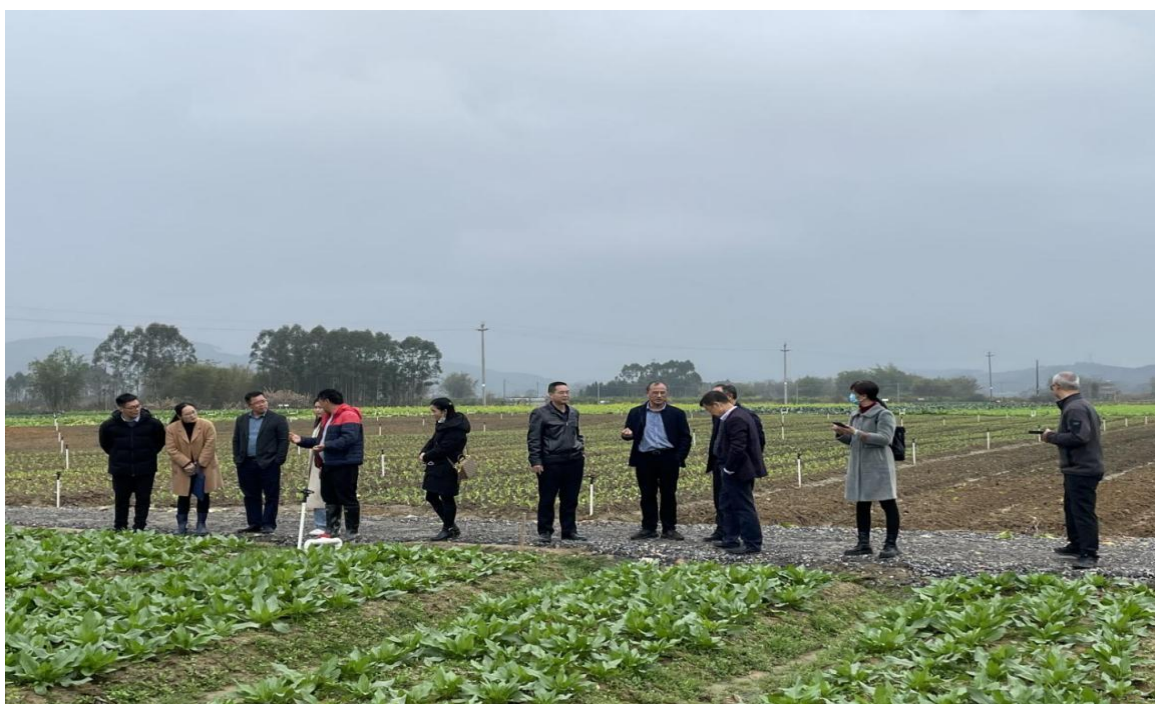
（专家一行到省级蔬菜产业基地参观调研）

为加强与粤港澳大湾区人才交流，加快推进武江区蔬菜省级现代农业产业园高质量发展，2月9日，广东省农科院、武江区委组织部、武江区农业农村局、武江区乡村振兴人才驿站联合举办了“粤港澳大湾区人才武江行”系列活动之“凝湾区智力 推蔬菜产业高质量发展”技术交流活动，活动采取专家现场指导与座谈交流方式进行，种植企业及种植大户约30人参加了活动。