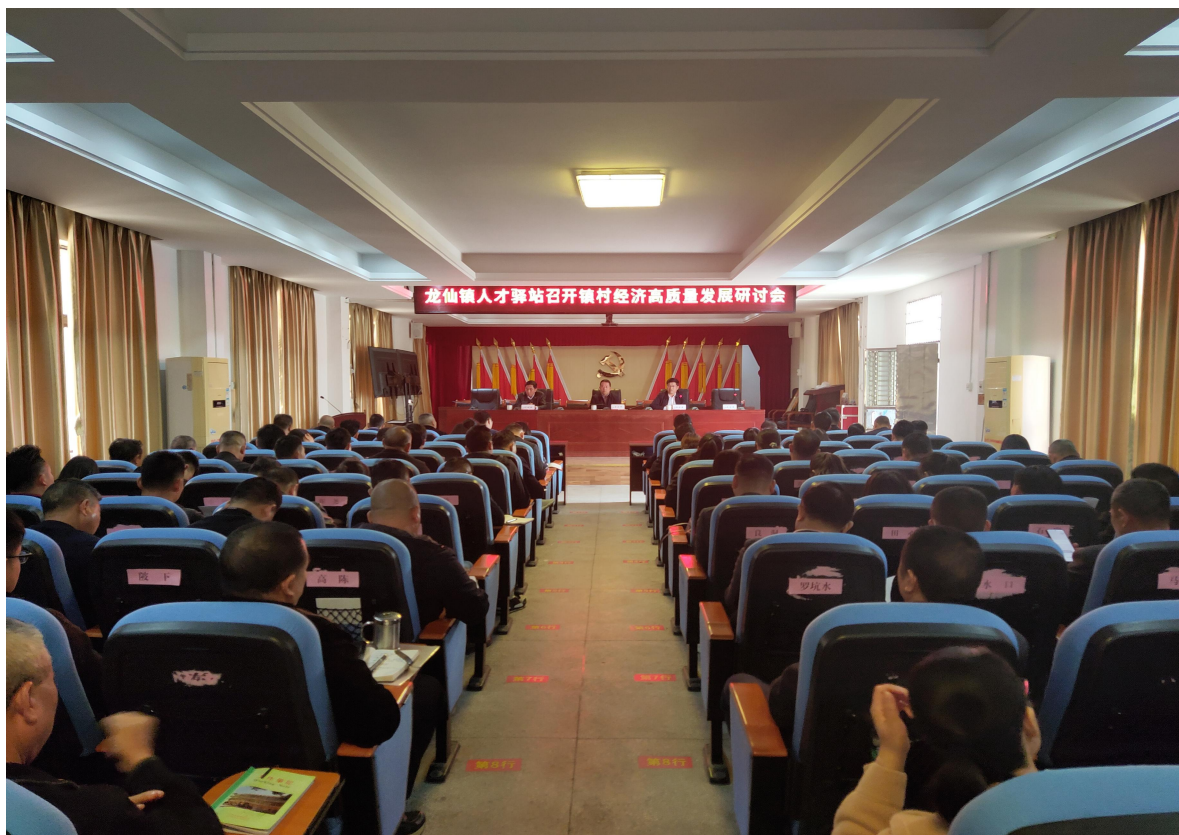
（高质量发展研讨会现场）

2023年2月24日，为进一步发挥乡村振兴人才驿站平台的作用，围绕翁源县委全会提出的“4211”工作目标，翁源龙仙镇乡村振兴人才驿站召开镇村经济高质量发展研讨会。