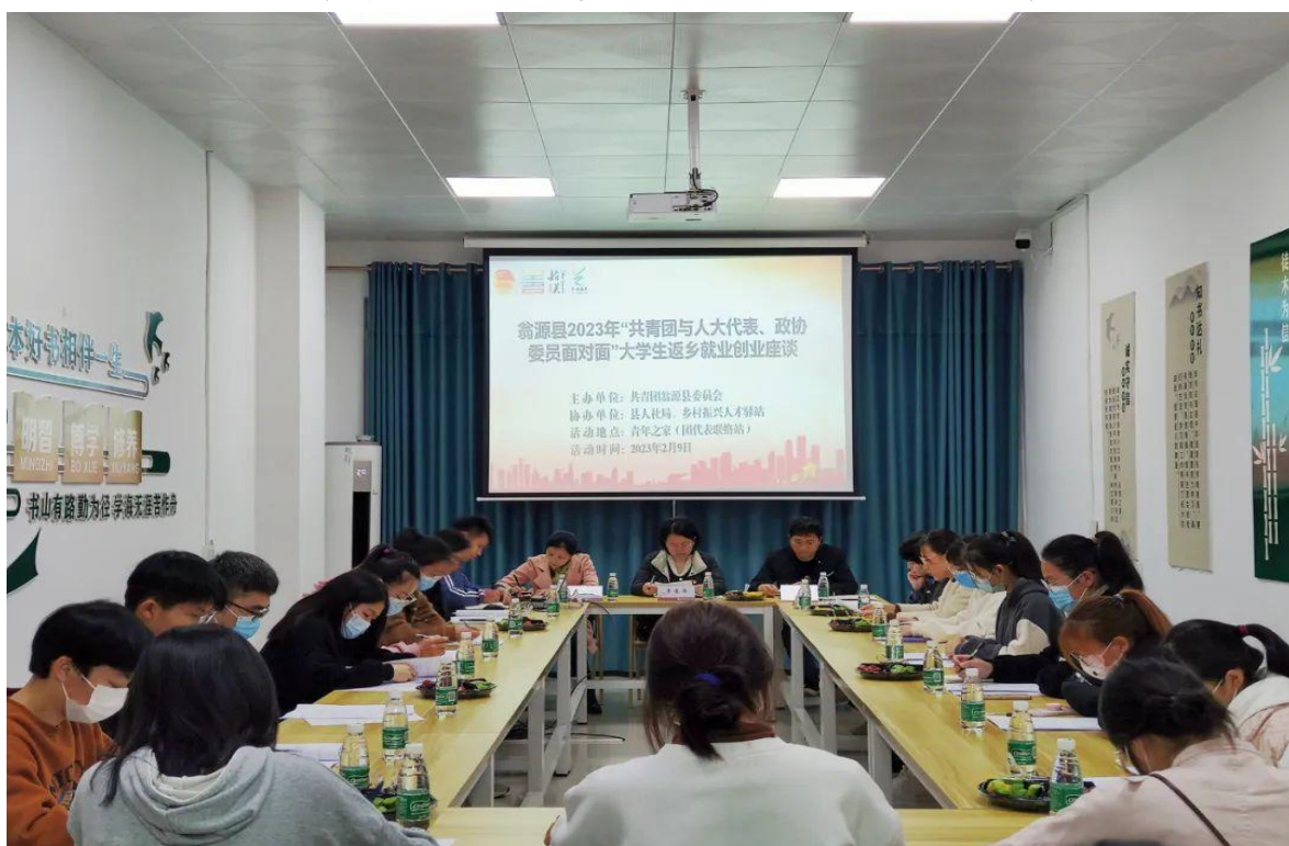
（大学生返乡就业创业座谈会现场）

为进一步发挥人大代表、政协委员在反映青少年利益诉求、维护青少年合法权益、引导青年成长成才方面的积极作用，结合“完善乡村振兴青年人才引育管用体制机制”“抓住重点群体、重点领域促进高校毕业生更充分更高质量就业”两大主题。2月9日，共青团翁源县委联合翁源县人社局、翁源县乡村振兴人才驿站在青年之家（团代表联络站）开展了翁源县2023年“共青团与人大代表、政协委员面对面”大学生返乡就业创业座谈活动。