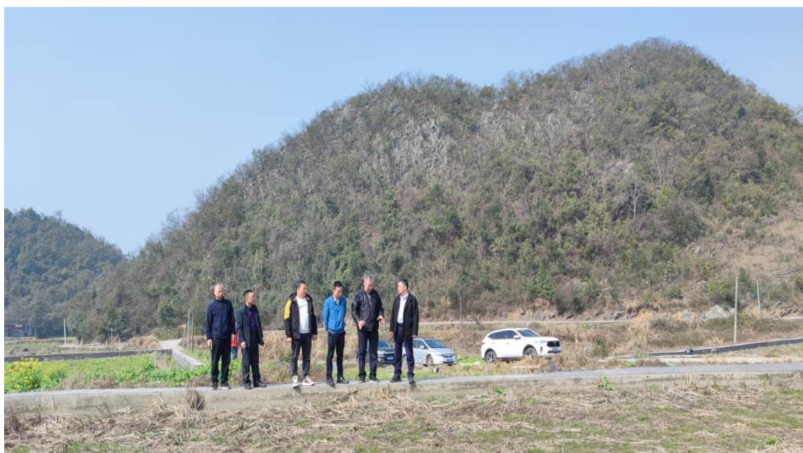
（黄樟翰一行到现场了解情况）

2023年2月21日，乳源大桥镇乡村振兴人才驿站邀请中国水产科学研究院珠江水产研究所研究员黄樟翰教授到大桥镇调研稻渔综合种养示范区建设情况，就示范区建设、养殖推广、品牌建设等提出宝贵建议。乳源县委编办、乳源县农业农村局、大桥镇相关领导陪同。